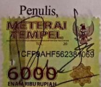
Dita Kurnia Fitri

Dibuat di : Magelang Pada tanggal : 27 Agustus 2020